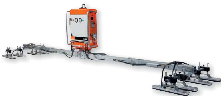
Konfiguration für Dachpaneele

VAKUUMMONTAGEGERÄT FÜR DACH- UND WANDPANELEE